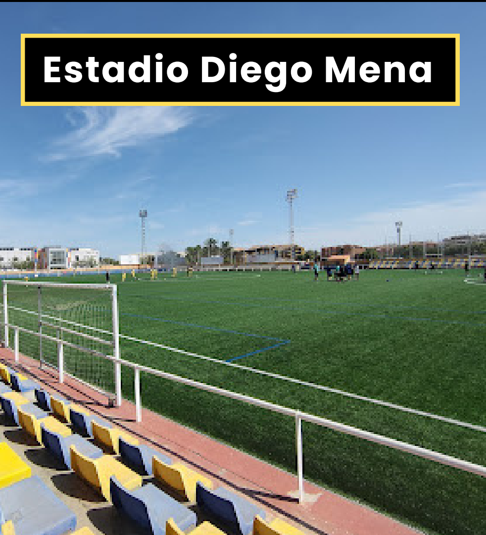
Estadio Diego Mena